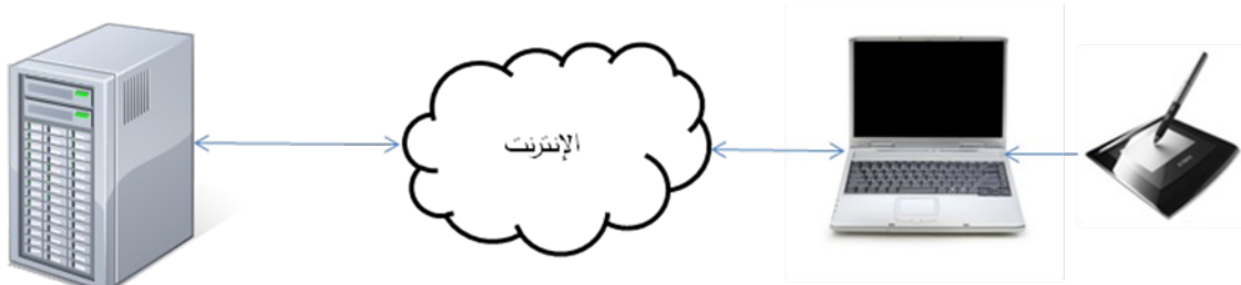
صورة رقم ٣

٢. مراجعة المستند ثم إدراج التوقيع الحيوي (كما في الصورة رقم ٣)