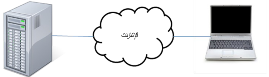
صورة رقم ٢

١. تحميل الوثيقة على مشغل الخدمة (كما في الصورة رقم ٢)